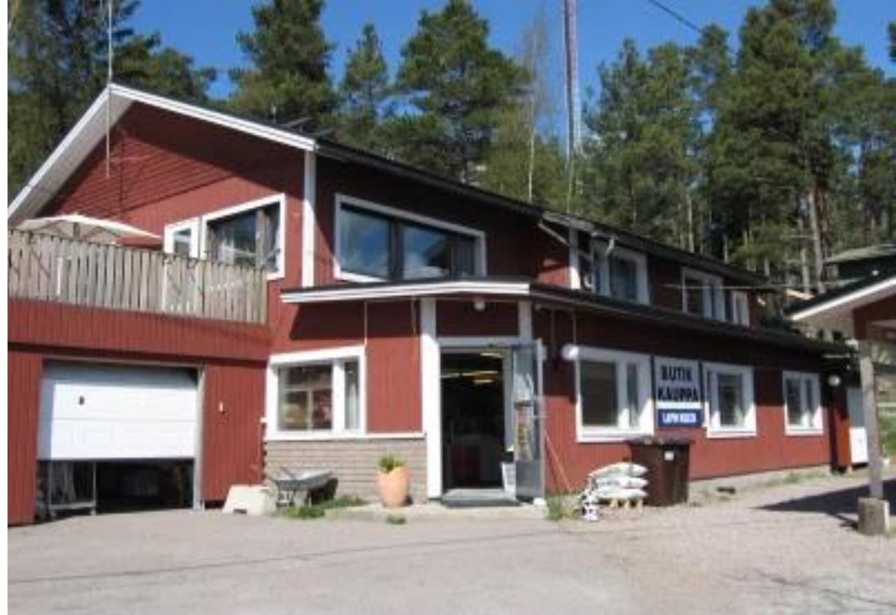
Björklöfs handel Mitt hem från 1981 - 2000